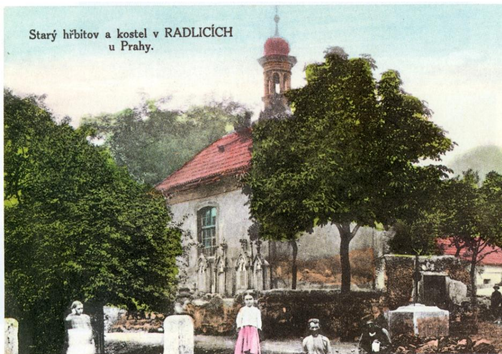
Kaple sv. Jana Nepomuckého z roku 1722. Byla obklopena hřbitovem, který dnes již neexistuje