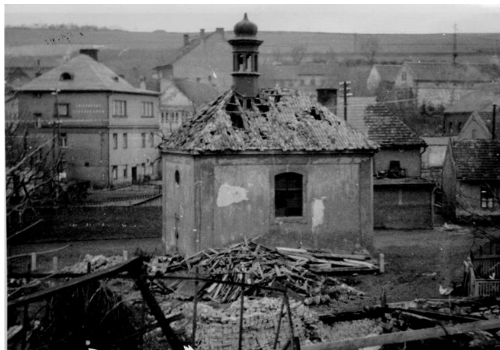
Stav po náletu 14.2.1945 Radlice byly zasaženy bombardováním spolu s Farkáněm jako první část Prahy