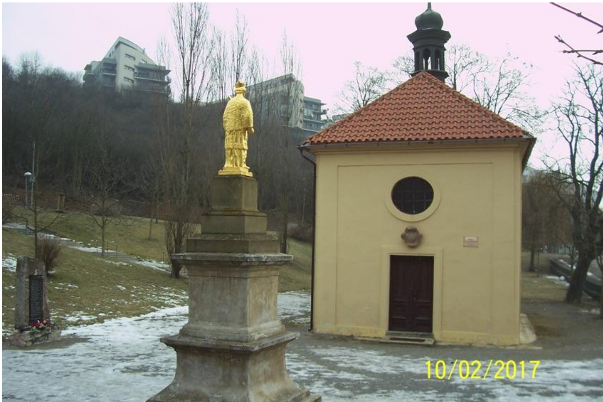
Dnešní stav zleva: pomníček obětem náletu 14.2.1945, socha sv. Jana Nepomuckého a kaple sv. Jana Nepomuckého – jediná stavba dochovaná z původní zástavby radlické návsi