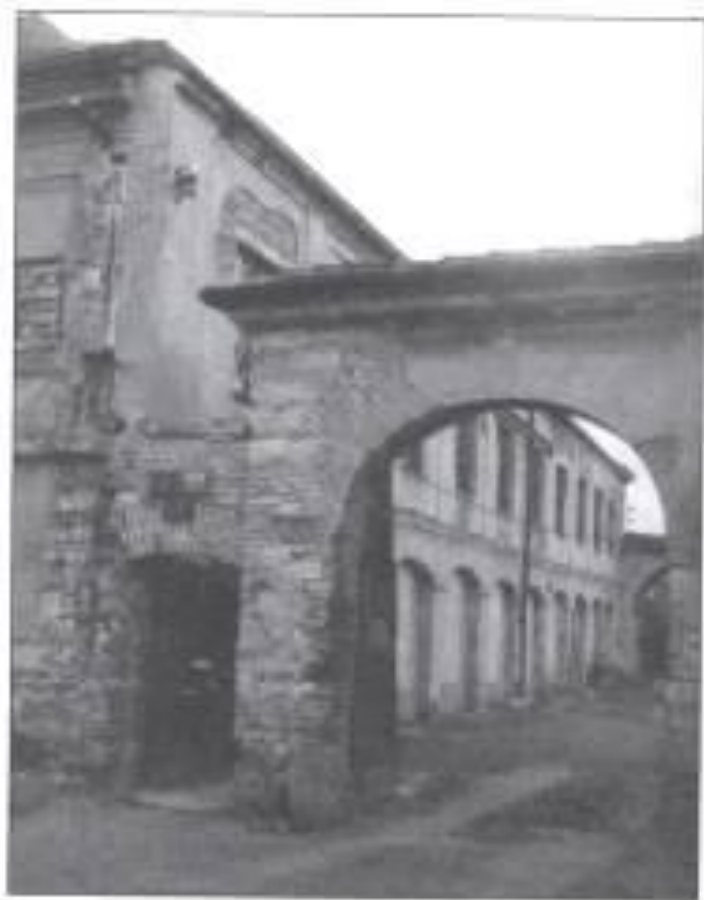
Usedlost řadu let chátrala

Ještě před pár lety zde stála hlavní budova usedlosti Vysoká. Dnes už můžeme vidět jen původní bránu usedlosti, část zdiva hlavní budovy byla začleněna do spodní moderní stavby.