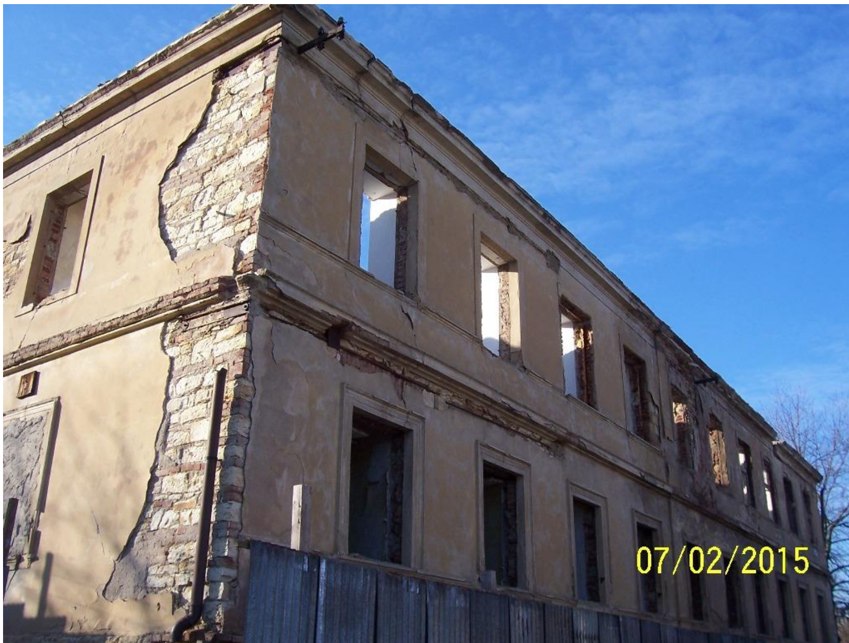
Zbytky hlavní budovy

Dále se vrátíme ulicí Na Vysoké I mírným klesáním k hlavní ulici Peroutkova. Před koncem ulice se zastavíme a podíváme se doleva na roh hotelu Albion.