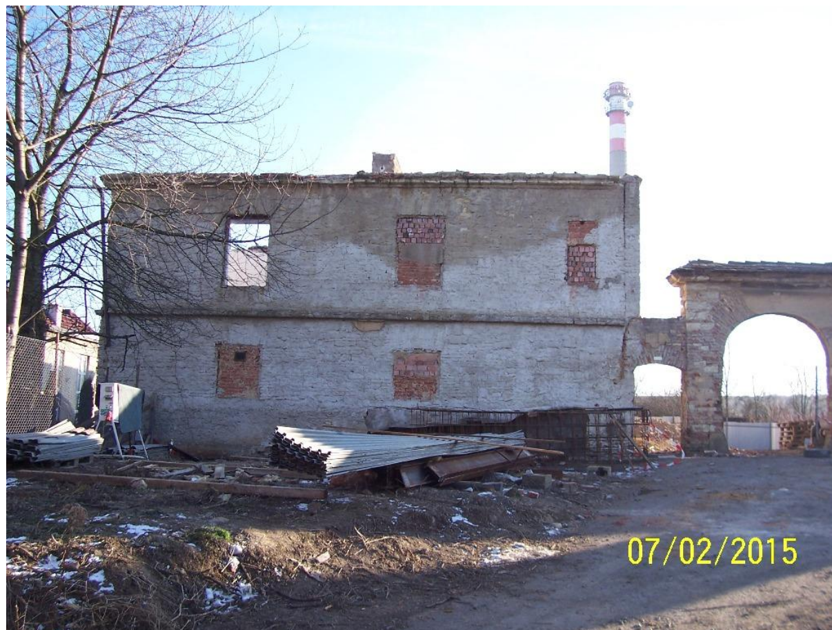
... a v roce 2015 už z ní zůstala jen část obvodové zdi a brána