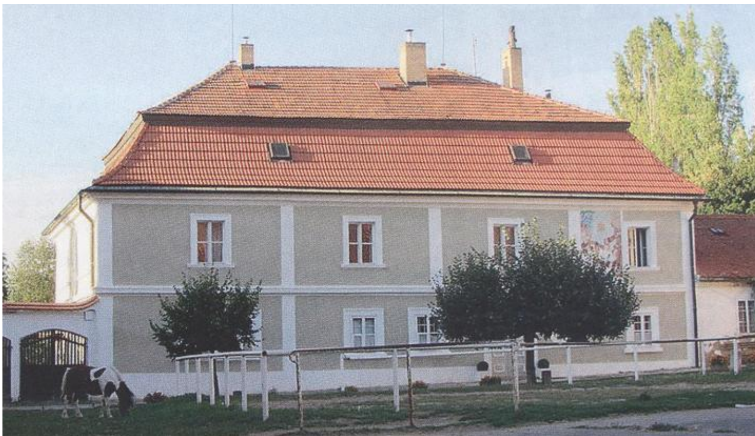
Dnešní stav usedlosti Bulovka.

Dále pokračujeme ulicí Peroutkova směrem do centra asi 200 m. Ještě než dojdeme na zastávku autobusu Farkáň, vidíme vpravo parčík s pomníčkem.