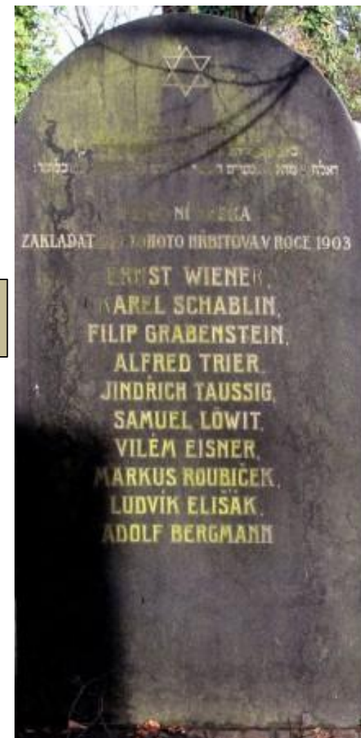
Deska zakladatelů hřbitova