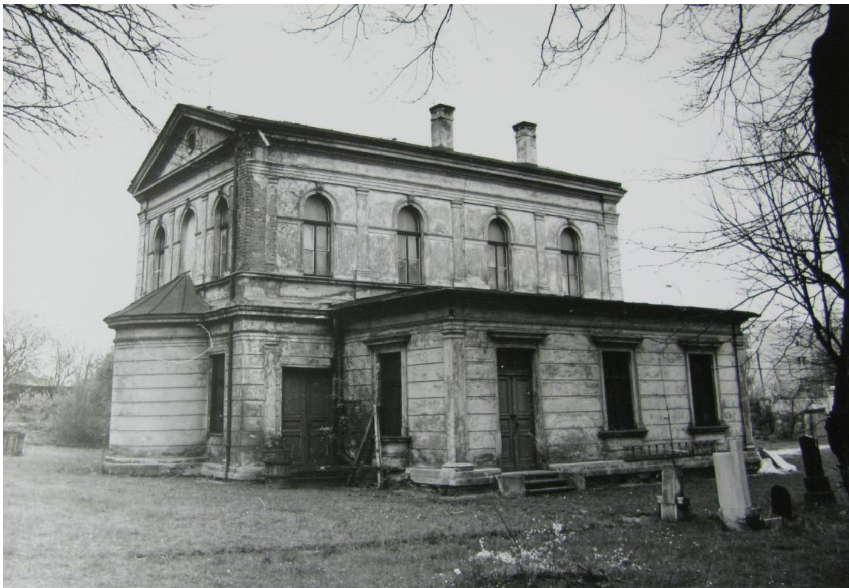
Bývalá židovská obřadní síň

Předchůdcem Nového židovského hřbitova byl Starý židovský hřbitov na kopci Brabenec (Brabenčák) v Radlicích, který vznikl v roce 1788 z důvodu nedostatku místa na hřbitově v pražském Josefově a fungoval až do roku 1937.