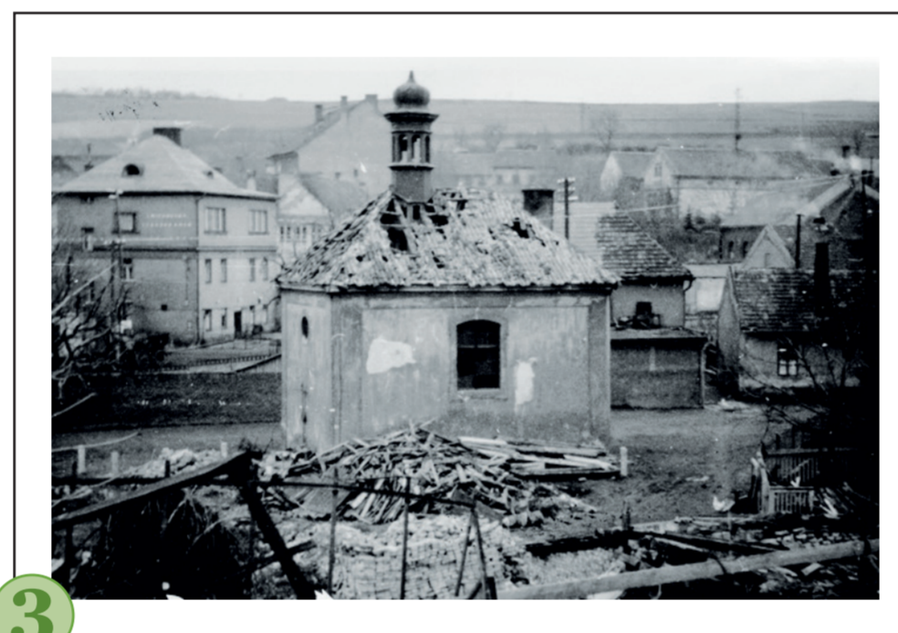
č. 3 Stav po náletu 14. 2. 1945. Radlice spolu s Farkáněm byly zasaženy bombardováním jako první části Prahy.