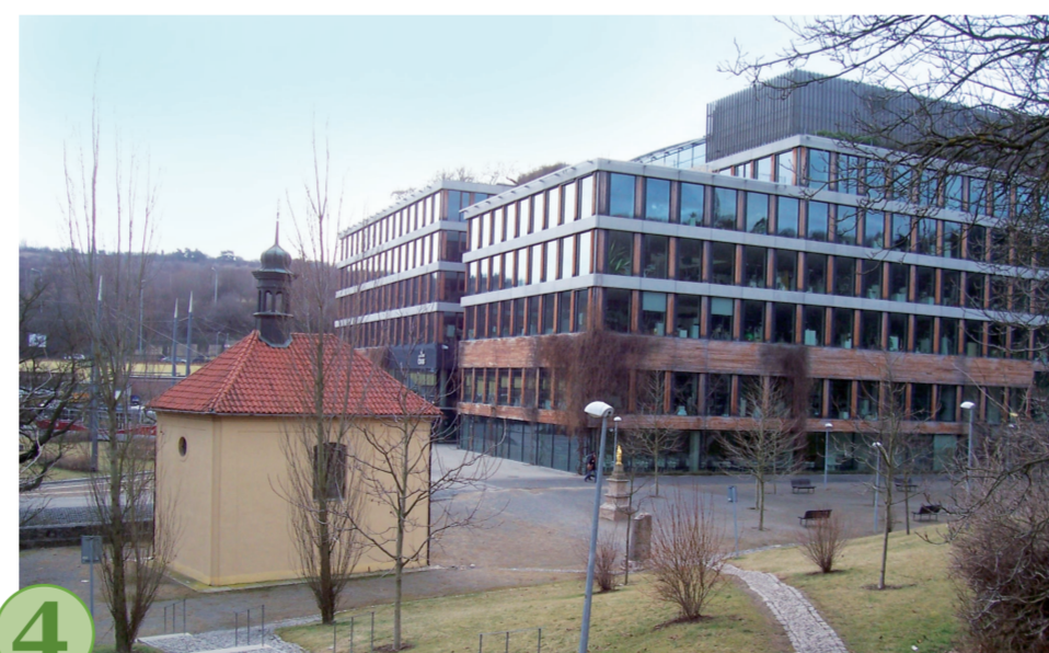
č. 4 Dnes prostoru dominuje budova ústředí ČSOB z roku 2007, dílo architekta Josefa Pleskota. Zajímavé je zasazení objektu bankovní instituce do přírody. Před budovou ČSOB byla v roce 2008 postavena tramvajová smyčka.