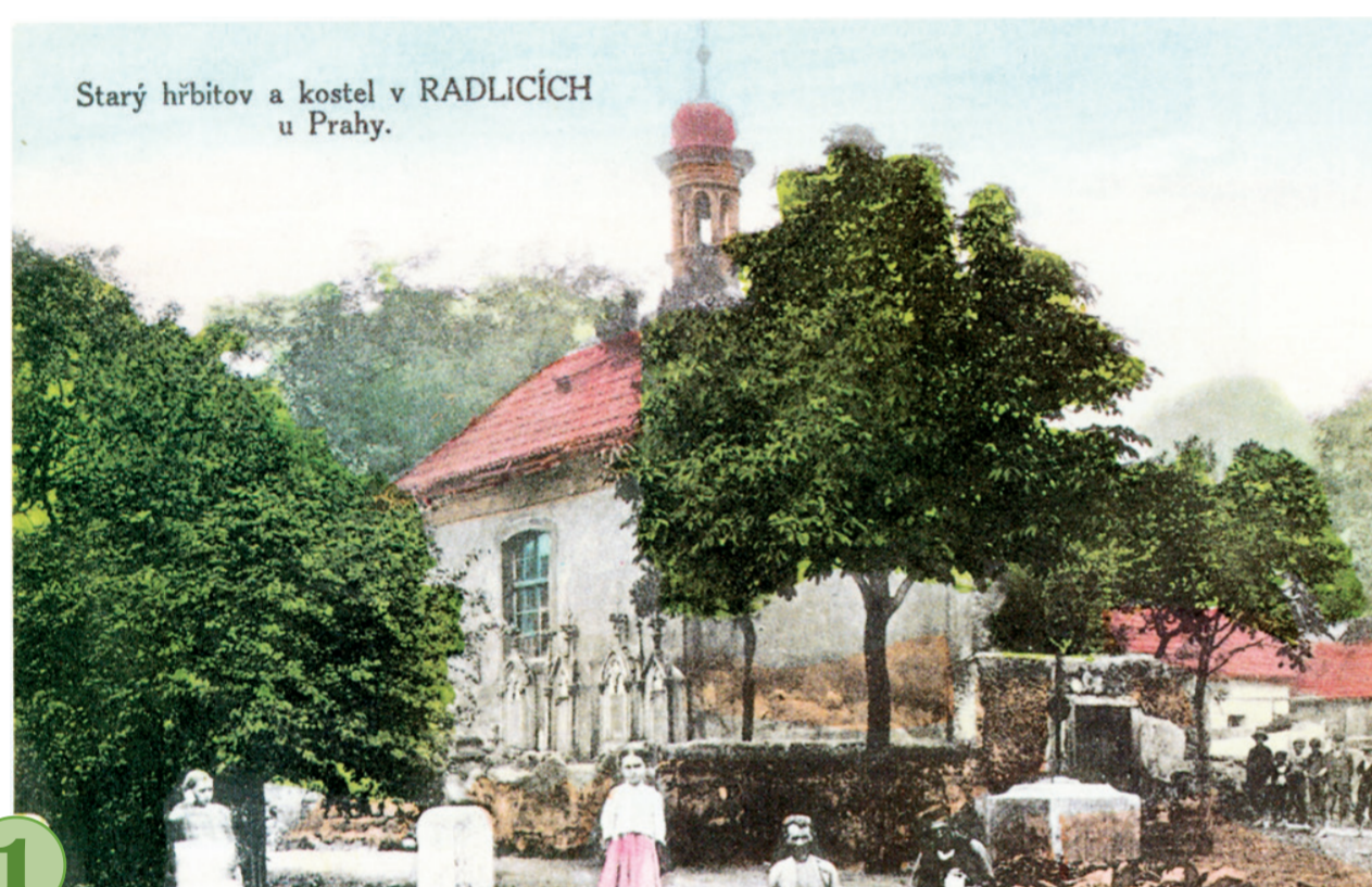
č. 1 Kaple sv. Jana Nepomuckého z roku 1722. Byla obklopena hřbitovem, který dnes již neexistuje.