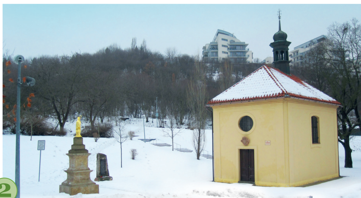
č. 2 Dnešní stav: zleva socha sv. Jana Nepomuckého, pomníček obětí 2. světové války a kaple sv. Jana Nepomuckého - jediná dochovaná z původní zástavby radlické návsi.