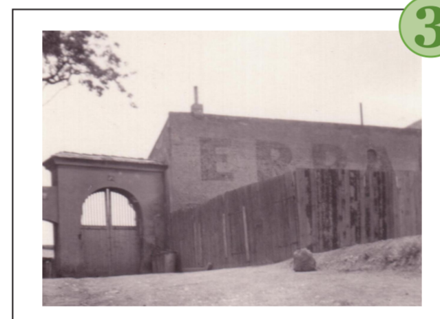
č. 3 Přelom 19. a 20. století - vstupní brána a provoz ERPA.