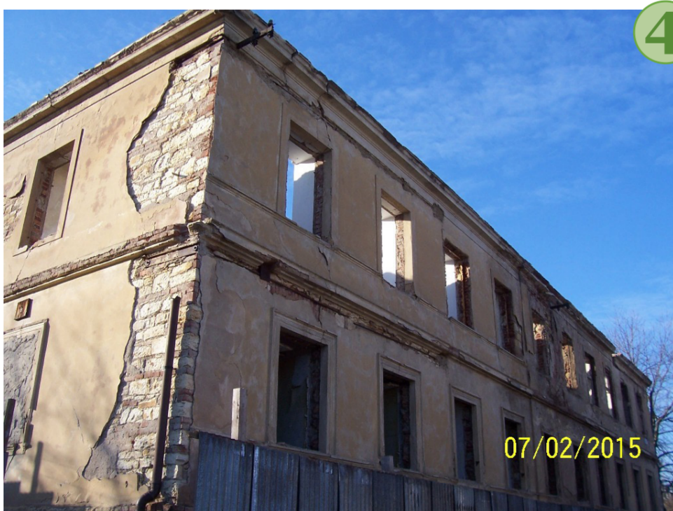
č. 4 Dům v r. 2015. Zchátralý objekt v roce 2015.