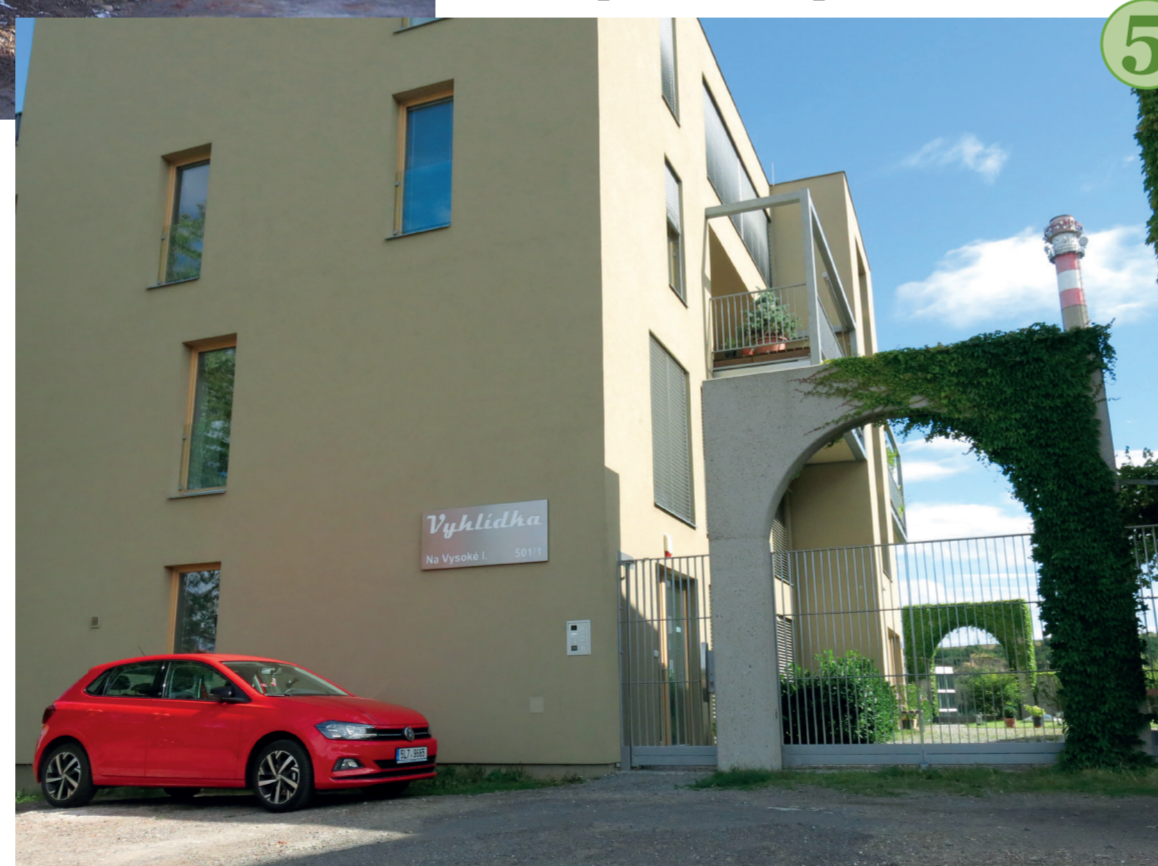
č. 5 Dnešní areál Vyhlídka. Brána s kulatým obloukem je malou připomínkou původní architektury.