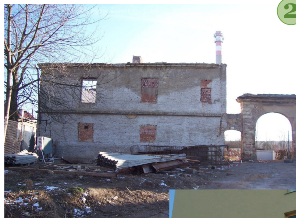
č. 2 Brána v r. 2015. Pohled na bývalou usedlost se vstupní branou těsně před demolicí v roce 2015.