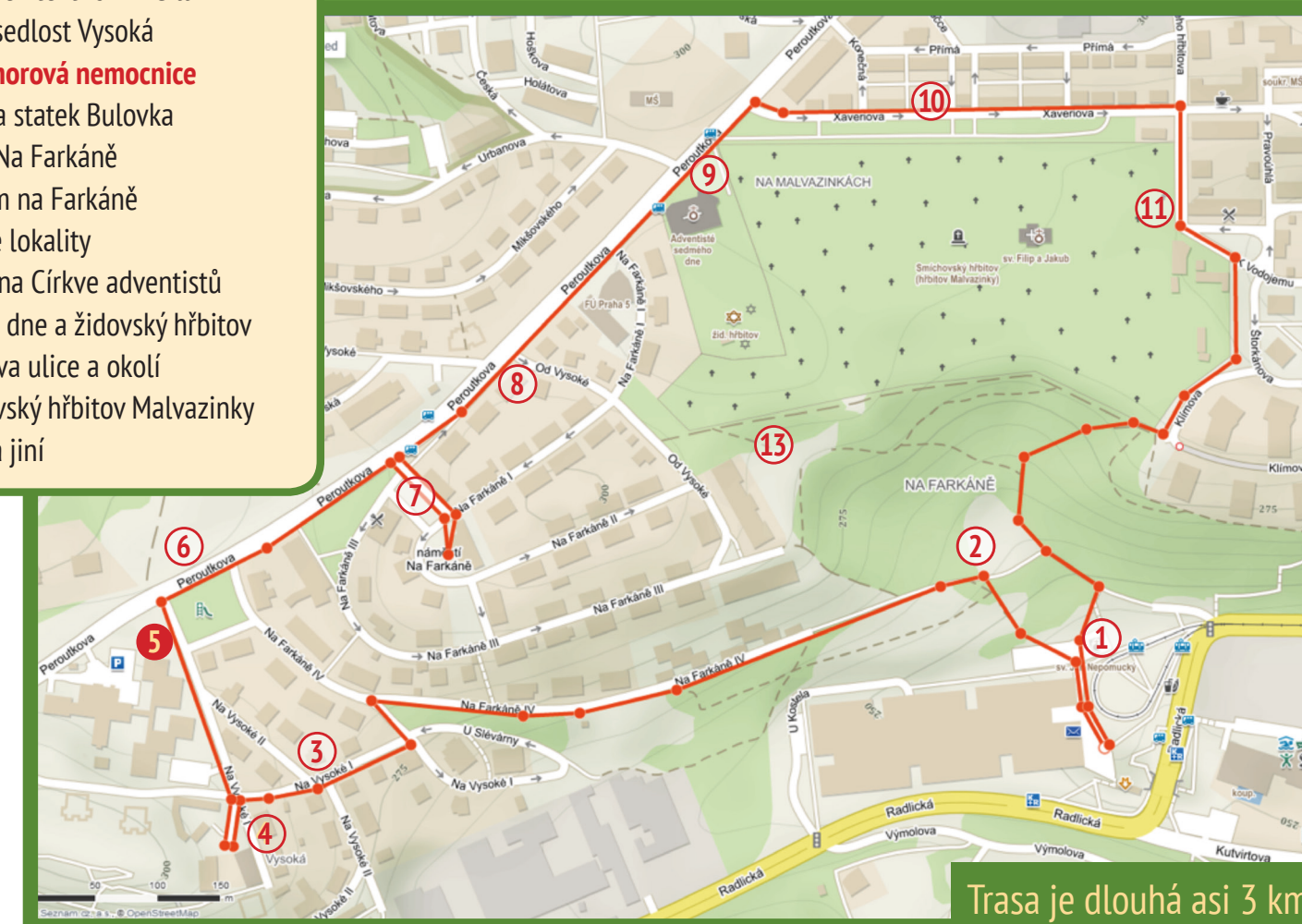
Trasa je dlouhá asi 3 km

Přejdeme na druhou stranu ulice Peroutkova, odtud již vidíme cíl dalšího zastavení 6.