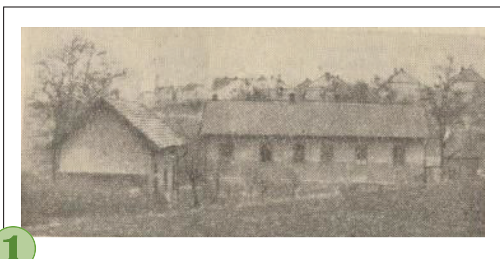
č. 1 Obrázek z Kroniky Jinonic a Butovic - noviny Nový signál.

V místech tohoto zastavení probíhá rozhraní mezi katastrálním územím Jinonice a Radlice. Kníže Ferdinand Vilém ze Schwarzenbergu zde v době moru v letech 1679–1680 založil morovou nemocnici, do které byli sváženi chudí, nakažení morem. Později zde stály dva menší obytné domky až do 60. let 20. století. Mezi starousedlíky se zde proto také říkalo „U nemocnice“. Toto označení najdeme i na staré mapě viz obr. č. 2. Existenci tohoto místa popsal občan Jinonic Alois Loučka v Kronice Jinonic a Butovic, která vycházela na pokračování v příloze novin Nový signál.