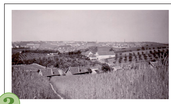
2 č. 2 Pohled od Vysoké na Bulovku.