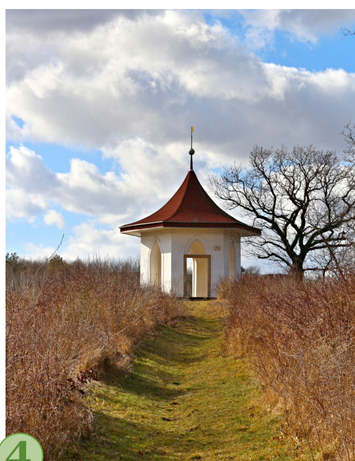
4 č. 4 Gloriet v zahradě usedlosti.