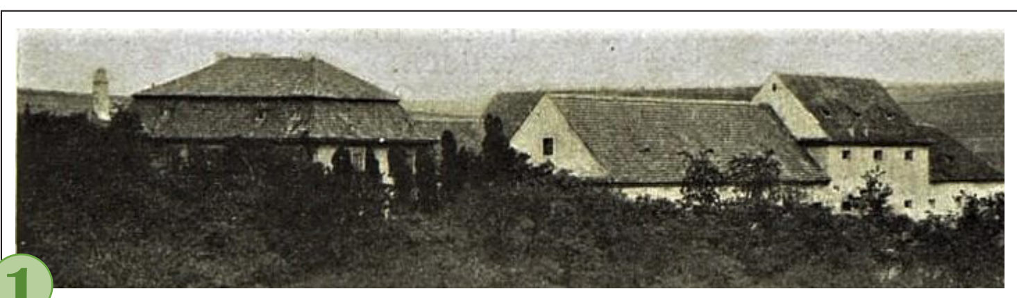
1 č. 1 Usedlost Bulovka v roce 1905.