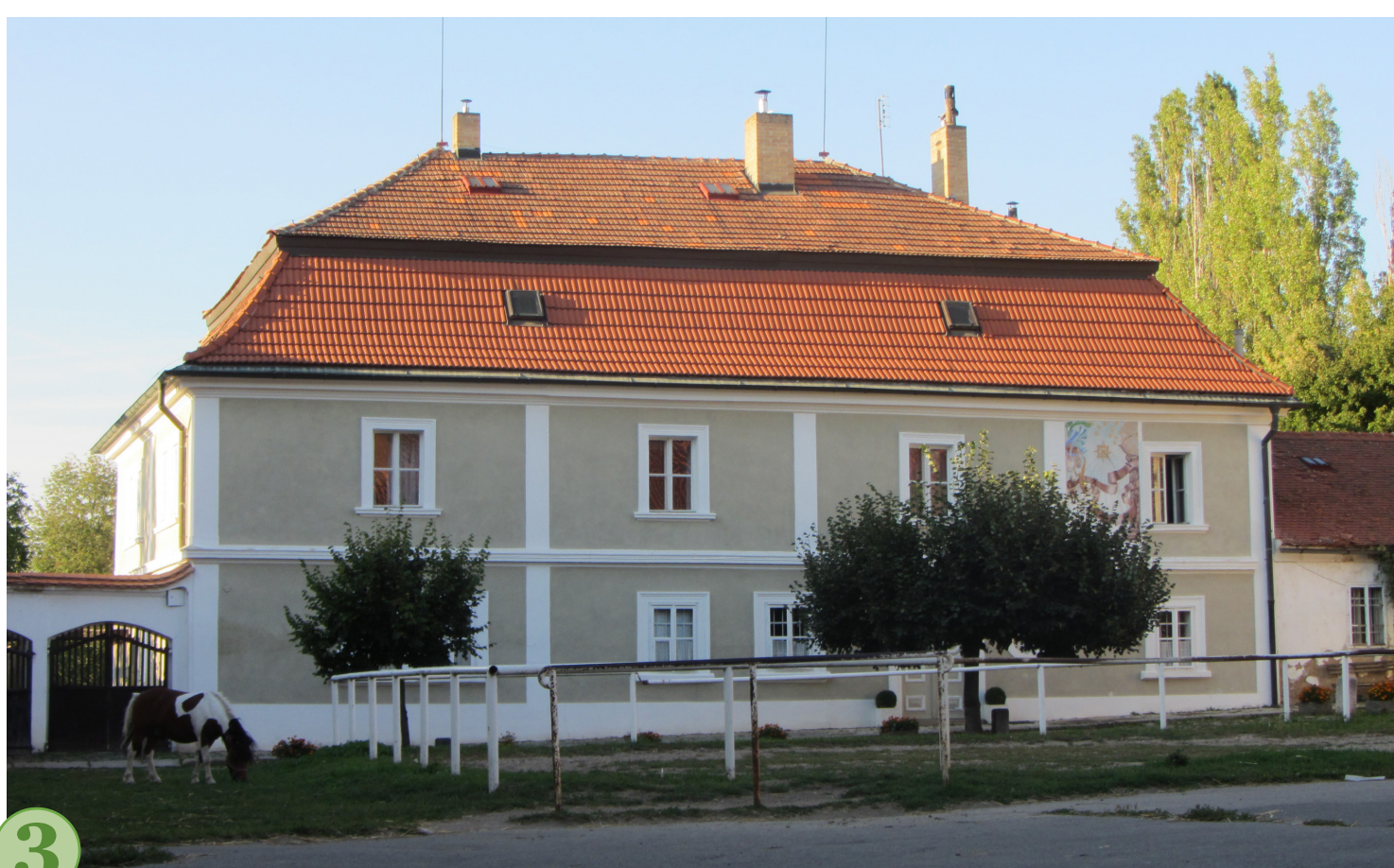
3 č. 3 Usedlost v dnešní podobě.