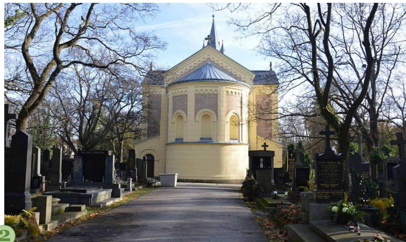
č. 1, 2 a 3 Kostel hřbitova Malvazinky (autor Josef Duchoň) je zasvěcen sv. Filipovi a Jakubovi, patronům Smíchova. Těm byl zasvěcen i původní kostel na Smíchově.